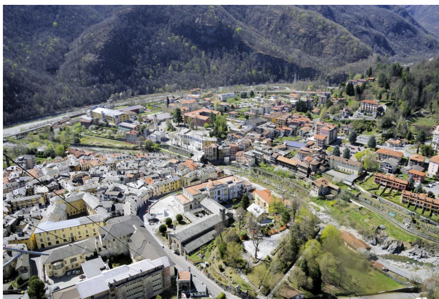
Varallo dal Sacro Monte