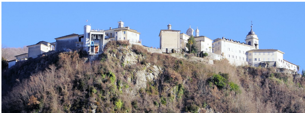
Il Sacro Monte