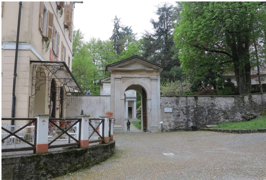
Ingresso alle cappelle del Sacro Monte

In cima al Sacro Monte, durante il pranzo al ristorante dell'Albergo risalente al 1700, proprio la guida ha introdotto il percorso lungo le cappelle del più antico ed importante Sacro Monte d'Europa, iniziato nel 1493 da padre Bartolomeo Caini. Dopo di lui la seconda fase della progettazione (di cui fu in realtà realizzato poco, restando in gran parte incompiuta rispetto a quanto previsto su carta nel Libro dei Misteri) fu affidata all'architetto perugino Galeazzo Alessi e la terza a San Carlo Borromeo, sotto la cui guida il Sacro Monte divenne un baluardo contro il protestantesimo.