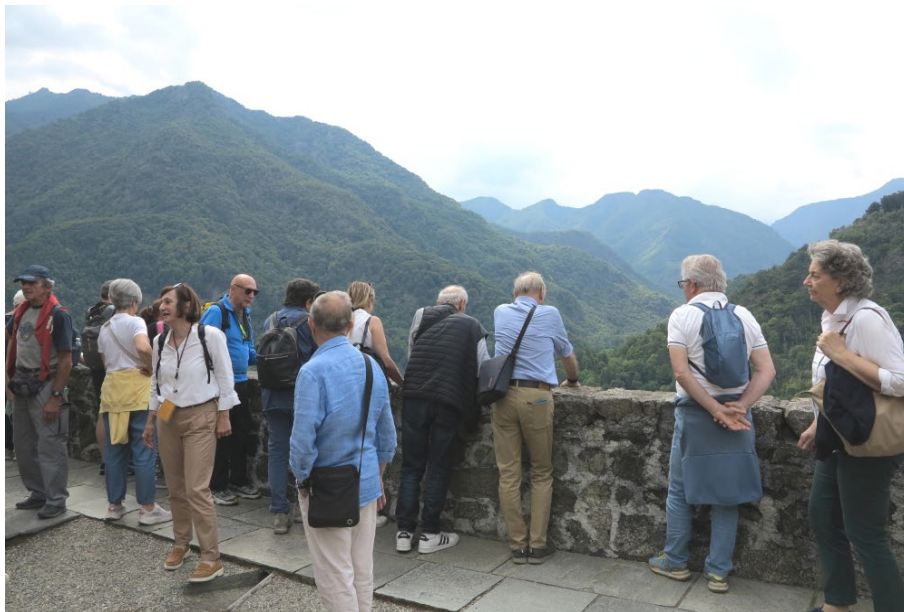
Vista verso l'alta Valsesia